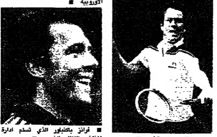
فرانز ياكوبس الذي تسلّم ادارة المنتخب الألماني الغربي